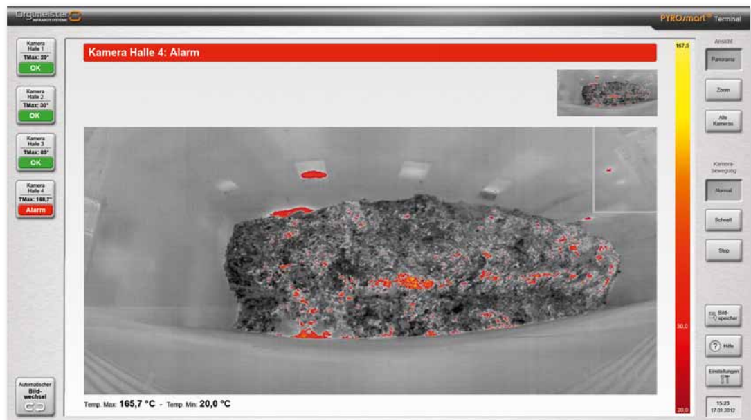
IR-Panoramadarstellung eines Müllbunkers und TouchScreen Bedienmenü